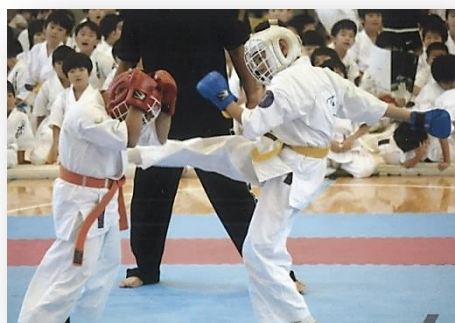
つらさに堪えて、倦まず弛まず努力する。

このような賞を授与することで、痛みやつらさに堪えて、倦まず弛まず努力することの大切さを教えているわけです。